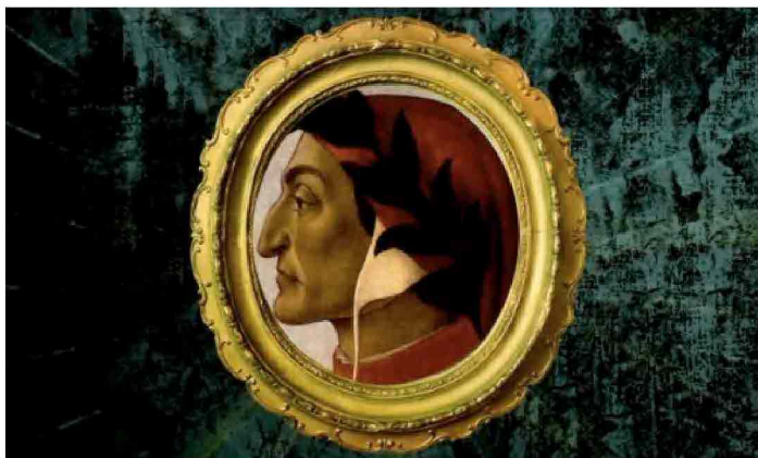
Particolare della copertina

Un incrocio tra H.G. Wells, Stephen Meyer e Michael Crichton: stiamo parlando, almeno secondo il lusinghiero giudizio di USA Today , di 333. La formula segreta di Dante , ultimo romanzo dello scrittore statunitense Robert Masello (curiosamente italianizzato in Roberto Masello dalla casa editrice Newton Compton).