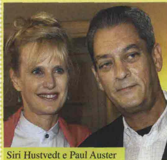
Siri Hustvedt e Paul Auster

Sopra, la coppia nella loro casa di Park Slope, a Brooklyn, New York. Sono sposati dal 1982. Tra i libri più importanti di Siri Quello che ho amato ed Elegia per un americano (Einaudi).