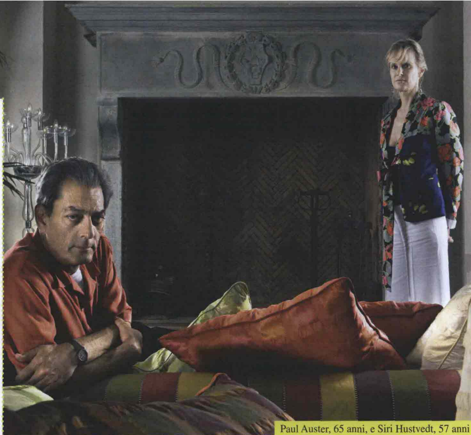
Paul Auster, 65 anni, e Siri Hustvedt, 57 anni