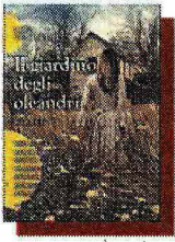
Rosa Ventrella «Il giardino degli oleandri» Newton Compton pp. 375, € 12