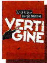
Erica Arosio & Giorgio Maimone «Vertigine» Baldini & Castoldi pp. 504, € 15,90