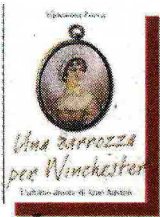
Giovanna Zucca «Una carrozza per Winchester» Fazi pp. 285, € 16,50