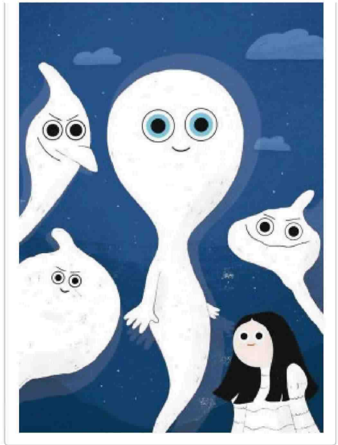
Illustrazione Carlotta Scalabrini