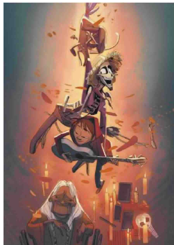
Illustrazione Lonnie Bao